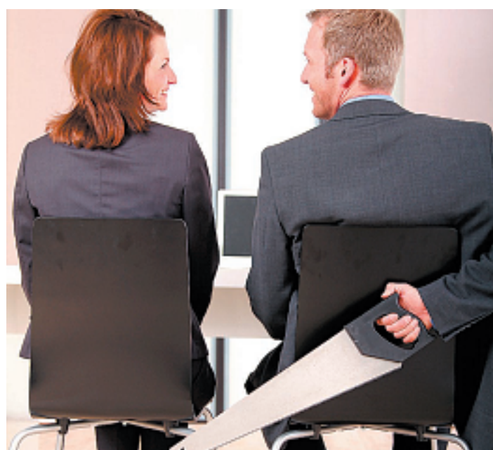
Beim Mobbing wird laufend am Stuhl des Mitarbeiters gesägt.

Acht Prozent der EU-Bürger werden an ihrem Arbeitsplatz gemobbt. Der ÖGB-Tirol-Vorsitzende Otto Leist will gegensteuern.